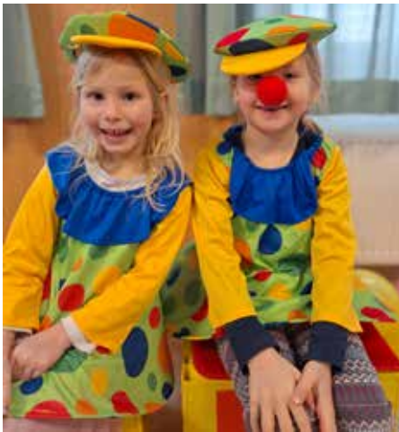
Clown´s dürfen im Zirkus nicht fehlen

Rückblick vom Kindergarten in der Faschingszeit von Sigrid Auböck-Mayr