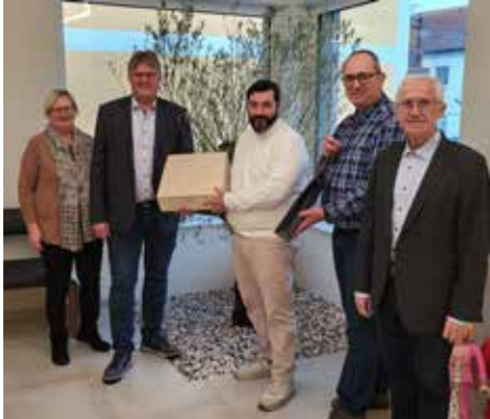
Erste Gratulanten zur Neueröffnung

Die Ansprüche an die moderne Zahnmedizin haben sich geändert. Unsere neue Zahnarztpraxis am Riedberg 2 ist seit Jänner für Sie geöffnet.