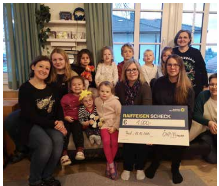
Die Freude ist groß über die großzügige Spende der ÖVP-Frauen

VIELEN HERZLICHEN DANK, damit wird jedes einzelne Fest noch viel schöner!