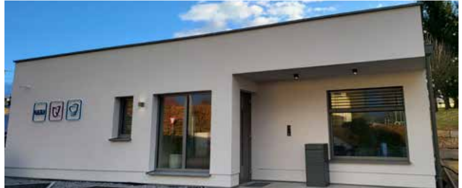
Ein neue moderne Zahnarztpraxis wurde am Riedberg 2 eröffnet

den Menschen zu helfen sich selbst zu helfen. Bei regelmäßigen Kontrollen und Mundhygienesitzungen kann man früh auf Ungereimthei-