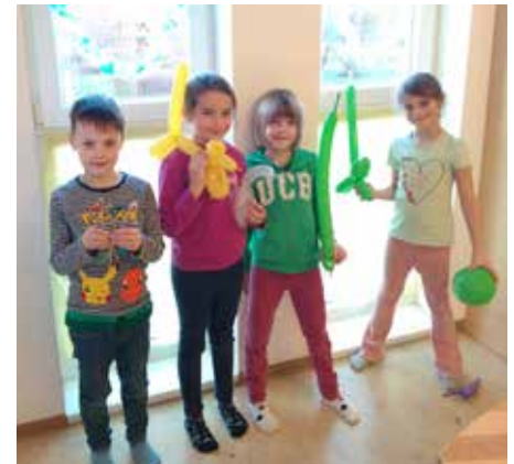
Kreative Figuren entstanden mit den Luftballons

fehlen- was bereits zur Tradition für unser Ferienprogramm wurde. Für unsere Fitness nahmen wir das örtliche Hallenbad in Anspruch und nutzten den, in den Ferien freien Turnsaal der Volksschule.