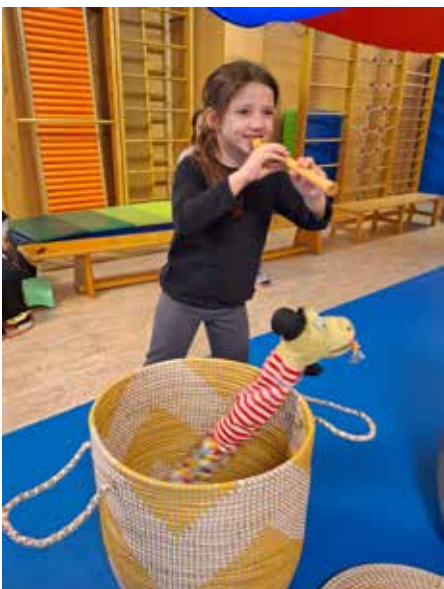
Hier tanzt die Schlange nach meiner Pfeife