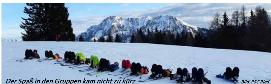
Der Spaß in den Gruppen kam nicht zu kurz

Nach fünf wundervollen Skitagen auf der Wurzeralm ging es am Freitagnachmittag zurück nach Ried, die äußerst ruhige Busfahrt und so manch geschlossenes Auge zeugten davon, dass auch der heurige (gottlob verletzungsfreie) Skikurs wieder ein voller Erfolg war.