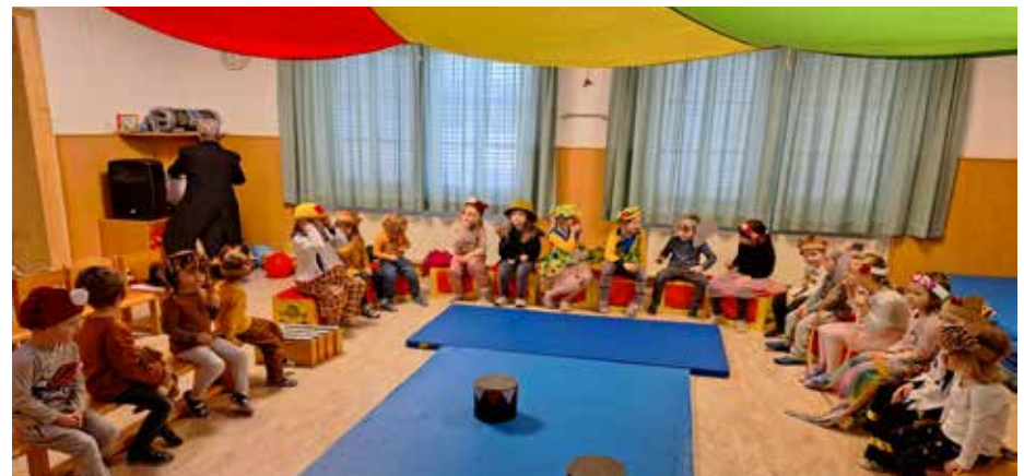
Die Kinder schlüpfen in die verschiedensten Verkleidungen