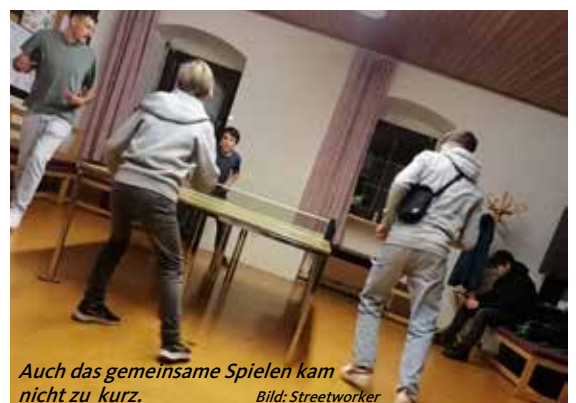
Auch das gemeinsame Spielen kam nicht zu kurz.