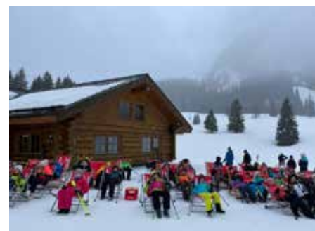
Eine verdiente Pause tut gut

Pistenkilometer gesammelt. Besonders stolz waren die Lehrkräfte auf die 18 Skianfänger/innen, welche allesamt den Sprung auf den Schlepplift bzw. Sessellift geschafft haben. Ein abwechslungsreiches und lustiges Abendprogramm gehört natürlich zu jedem Skikurs dazu. Angefangen bei selbst einstudierten und aufgeführten Sketches, über das Mattenrutschen im Schnee, bis zum jährlichen Höhepunkt – der Disco am letzten Abend. Gesanglich und tänzerisch gingen sowohl die Schüler:innen als auch Lehrkräfte an ihre Grenzen. Nicht fehlen durfte selbst-