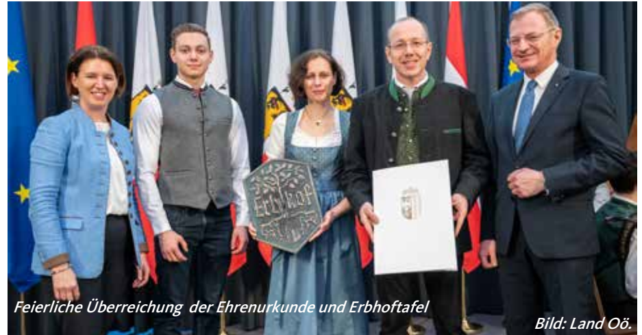
Feierliche Überreichung der Ehrenurkunde und Erbhoftafel

laden. Bei dieser feierlichen Veranstaltung wurden die neuen Erbhofträger geehrt, und es wurden ihnen gebührend eine Ehrenurkunde und eine Erbhoftafel überreicht. Bürgermeister Christian Tauschek schließt sich gerne den Glückwünschen an und gratuliert herzlich.