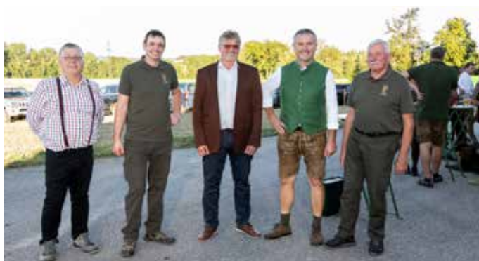
Bezirkstreckenlegung am 11. und 12. August

ganz im Zeichen der Jägerschaft. Bei strahlendem Sonnenschein fand am Freitag die Bezirkstreckenlegung statt. Am Samstag bedankte sich die Jägerschaft bei den Grundbesitzern. Gefeierte wurde mit kulinarischen Köstlichkeiten. Gratulation für die gelungene Veranstaltung und herzlichen Dank für die gute Zusammenarbeit!