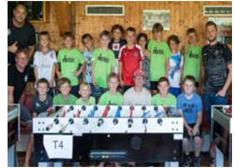
TFC Pirates Tischfußball

licher Dank gebührt den unermüdeten Teilnehmern, den Kindern selbst. Eure Begeisterung und aktive Teilnahme haben diese Ferienaktionen zu etwas Besonderem gemacht.