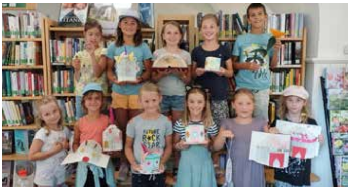
Fleißig gebastelt wurde in der Rieder Bibliothek

Die Tage des 11. und 12. Augusts standen in Anzendorf